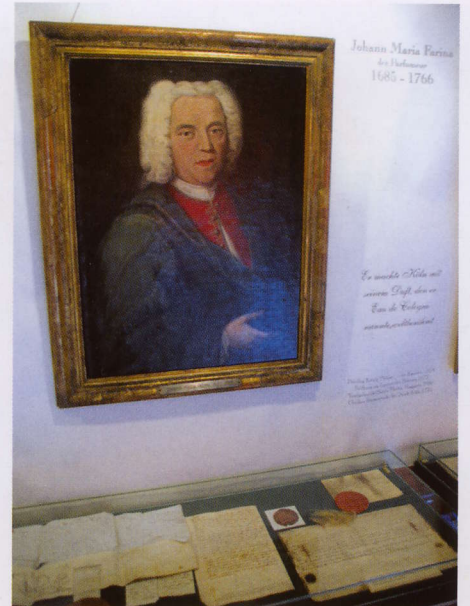
Geniální Giovanni Maria Farina