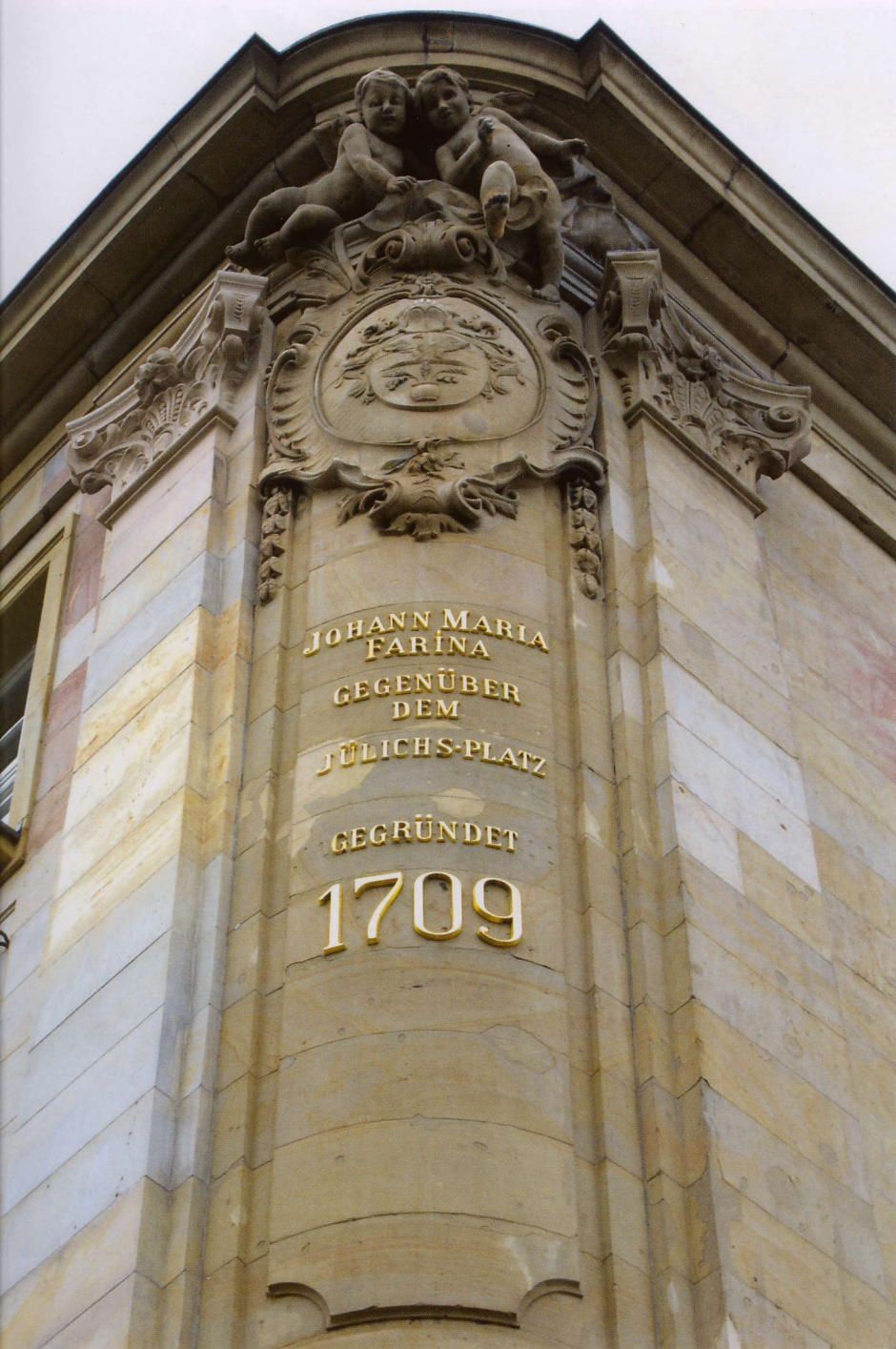
V tomto domě se před 300 lety započalo s výrobou slavné kolínské vody Farina.

Fariny stává světoznámým městem voňavkářství. I nejnavštěvovanější památka Německa, slavná katedrála, byla dokončena později. Tyčí se nedaleko za domy, kde bydlel.