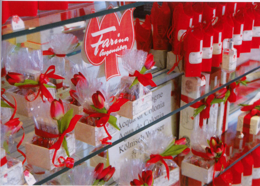
Mezi flakony a tulipány v Kolíně nad Rýnem