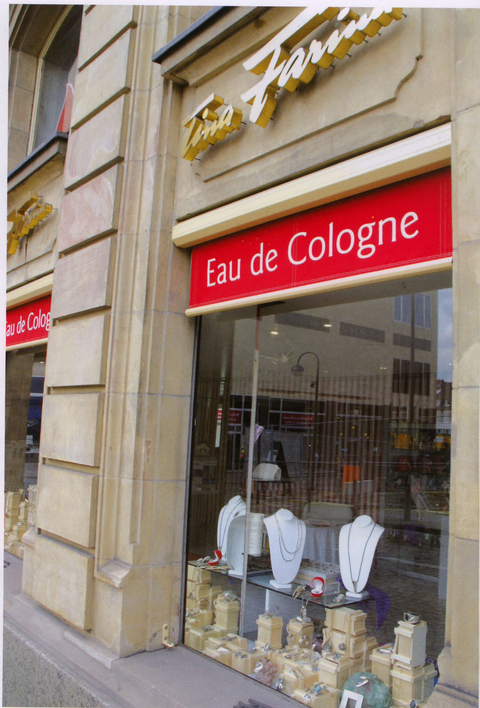
Tina Farina, další potomek slavného rodu má na starosti chod muzea.