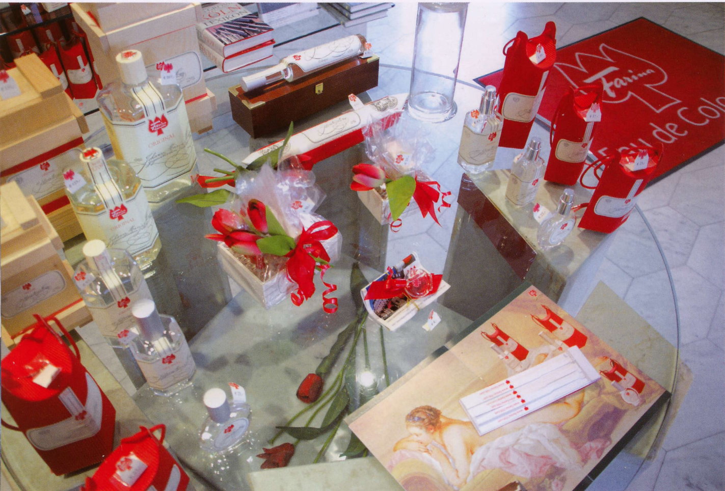
Nejen stejná vůně, ale i nenápadně měněný design odlišuje Farinu od konkurence.

design odlišuje Farinu od svých následovníků a konkurentů. Když změna, tak nepozorovatelná a nenápadná. V původním domě na ulici Obenmarspforden 21, na-